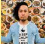
カレー偏愛家 カレーおじさん\(^o^)/